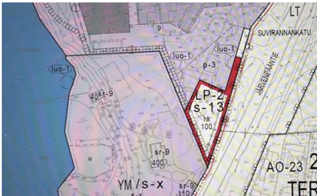
SRK-opiston puoleinen alue, jolle suunnitellaan uudisrakennus ja pysäköintialue (LP-2-alue).